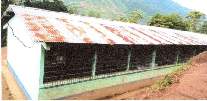
Foto1: Sustitución de lámina por lámina troqueladas